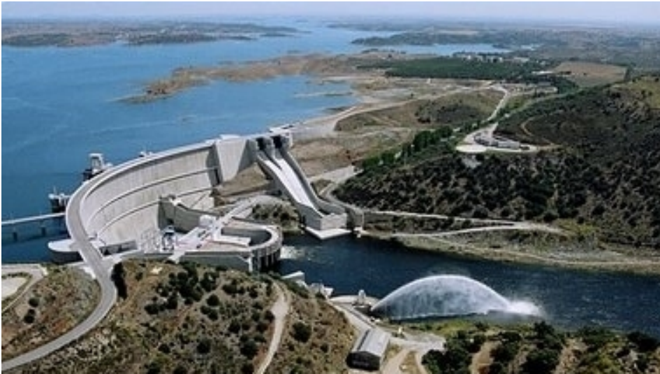
صورة لسد ألكيفا على نهر غواديانا بمنطقة ألينتيجو، البرتغال

سد ألكيفا هو أكبر خزان اصطناعي للمياه في البرتغال بقدرة تخزين تصل إلى 4.150 مليون متر مكعب من الماء، ويساعد على ري حوالي 120 ألف هكتار من الأراضي الزراعية وتقليل آثار الجفاف في منطقة ألينتيخو.